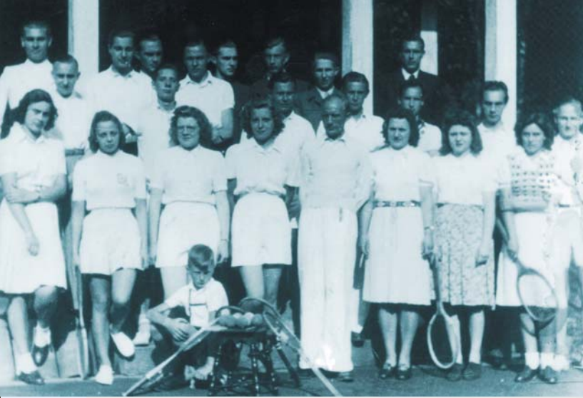
Funktionale Tennis- kleidung vor 60 Jahren und das Klettergerüst im Schlosspark. Wer kennt es nicht?

platz entstehen: ein Verein. So kurz nach Kriegsende hatten die Alliierten Vereinsgründungen allerdings noch strikt verboten, was die Hertener Tennisspieler erfinderisch werden ließ. Als Abteilung der bereits bestehenden Spielvereinigung Hertener nahmen sie 1947 den Spielbetrieb auf.