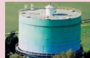
Foto A Seite: ____

Herten erleben lesen – und genau hinschauen: Finden Sie heraus, aus welchen Artikeln im aktuellen Heft die drei unten abgebildeten Fotoausschnitte stammen und ordnen Sie jedem Bild die richtige Seitenzahl zu.