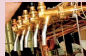
Foto C Seite: ____

Schicken Sie uns die Lösung bis zum 25. September 2006 mit dem Stichwort „Bilderrätsel“ an: Herten erleben , „AufEwald“, Lise-Meitner-Straße 11, 45699 Herten. Unter allen richtigen Einsendungen werden fünf Gewinner ausgelost. Der Rechtsweg ist ausgeschlossen.