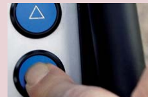
Foto C Seite: ____

Schicken Sie uns die Lösung bis zum 31. Juli 2006 an die Redaktion Herten erleben , AufEwald, Lise-Meitner-Straße 11, 45699 Herten. Einsendeschluss: 31. Juli 2006. Unter allen richtigen Einsendungen werden fünf Gewinner ausgelost. Der Rechtsweg ist ausgeschlossen.