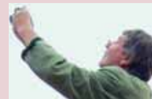
Foto B Seite: ____