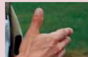
Foto C Seite: ____

Schicken Sie uns die Lösung bis zum 31. Januar 2006 mit dem Stichwort „Bilderrätsel“ an: Herten erleben im ZukunftsZentrum Herten, Konrad-Adenauer-Straße 9 – 13, 45699 Herten. Unter allen richtigen Einsendungen werden fünf Gewinner ausgelost. Der Rechtsweg ist ausgeschlossen