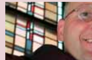
Foto A Seite: ____

Herten erleben lesen – und genau hinschauen: Finden Sie heraus, aus welchen Artikeln im aktuellen Heft die drei unten abgebildeten Fotoausschnitte stammen und ordnen Sie jedem Bild die richtige Seitenzahl zu.