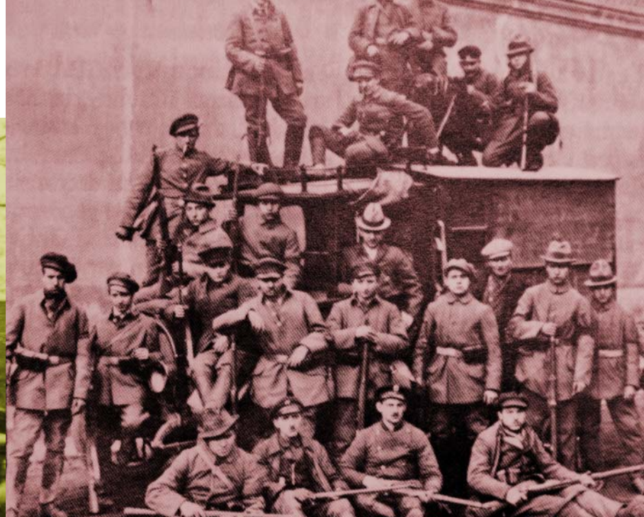
Hertener Geschichte: 1880 wurde der Hertener Wochenmarkt (Fo. ganz li.) geboren, 1920 stellt sich die linke Ruhr-Armee (Fo. li.) gegen die Kapp-Putschisten, 1960 eröffnete die Südtiroler Tourismusbranche ein Büro in Herten.

31. März fallen dort gleich zweimal schwer bewaffnete Trupps ein, die die Verwaltungsgebäude verwüsten und alles mitnehmen, was nicht niet- und nagelfest ist. Anfang April reißt schließlich der Geduldsfaden der Reichsregierung. Sie lässt die Reichswehr ins Ruhrgebiet einmarschieren, die den Aufstand innerhalb einer Woche brutal niederschlägt.