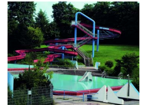
Bei Temperaturen unter 20 Grad verirrt sich kaum ein Besucher ins Freibad des Copa.