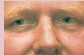
Foto B Seite: ____