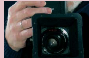
Foto A Seite: ____

Herten erleben lesen – und genau hinschauen: Finden Sie heraus, aus welchen Artikeln im aktuellen Heft die drei unten abgebildeten Fotoausschnitte stammen und ordnen Sie jedem Bild die richtige Seitenzahl zu.