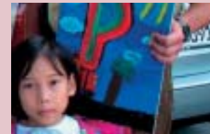
Foto B Seite: ____