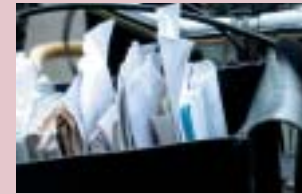
Foto A Seite: ____

Herten erleben lesen – und genau hinschauen: Finden Sie heraus, aus welchen Artikeln im aktuellen Heft die drei unten abgebildeten Fotoausschnitte stammen und ordnen Sie jedem Bild die richtige Seitenzahl zu.