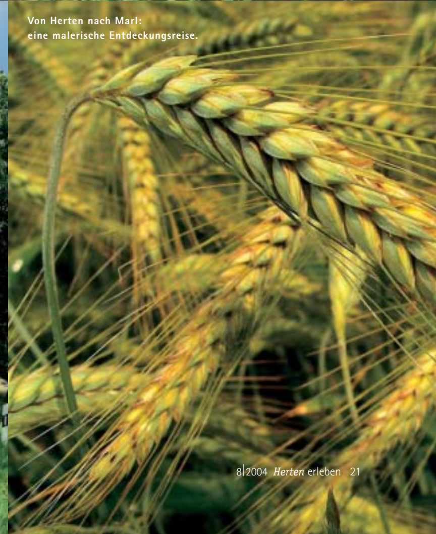
Von Herten nach Marl: eine malerische Entdeckungsreise.