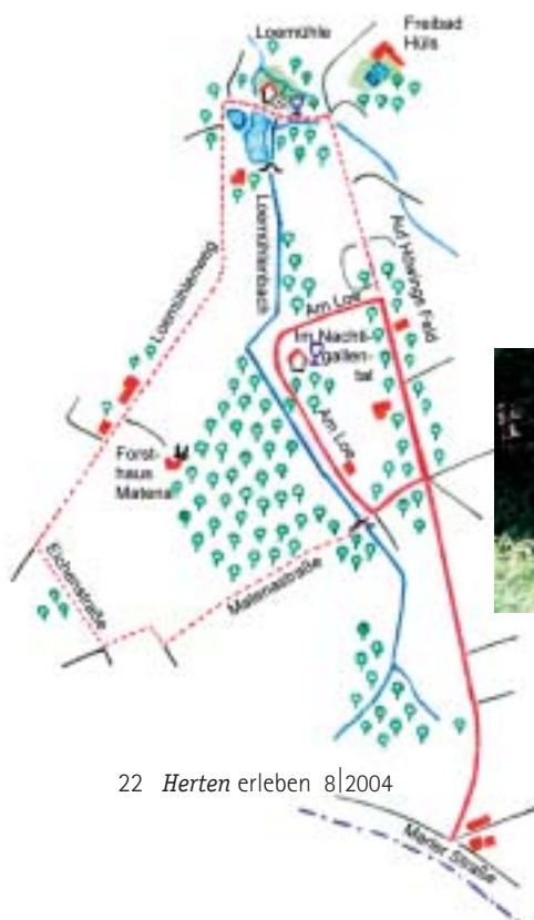
Wegbegleiter auf den Weg nach Marl.