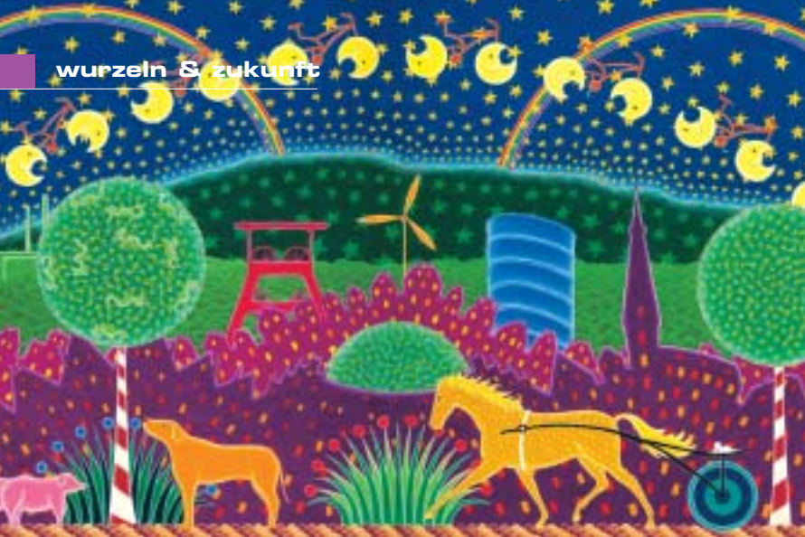
Der Zauberberg von Wolfgang Nocke.

Rechtzeitig zur Extraschicht kam die Enthüllung: Der weit über die Region hinaus bekannte Künstler aus Haltern am See, Wolfgang Nocke, hat seinen Zauberberg-Traum in einem wunderschönen Bild festgehalten. Ein langer, intensiver Traum. Denn die Umsetzung dieser Träumereien in Farbe auf die Leinwand, die unzählbaren Details, wie zum Beispiel die Sterne, die Monde, die bei näherem Hinsehen als Mountainbike-Räder zu erkennen sind, die nächtliche Silhouette von Herten, die Antoniuskirche und das Schloss, haben Monate künstlerischen Schaffens in Anspruch genommen.