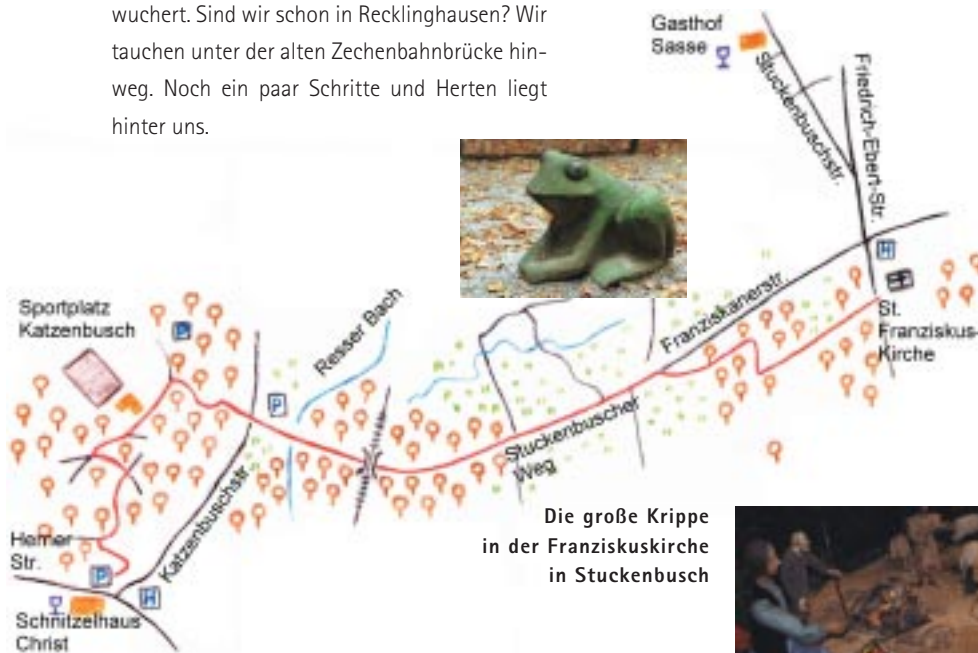
Die große Krippe in der Franziskuskirche in Stuckenbusch