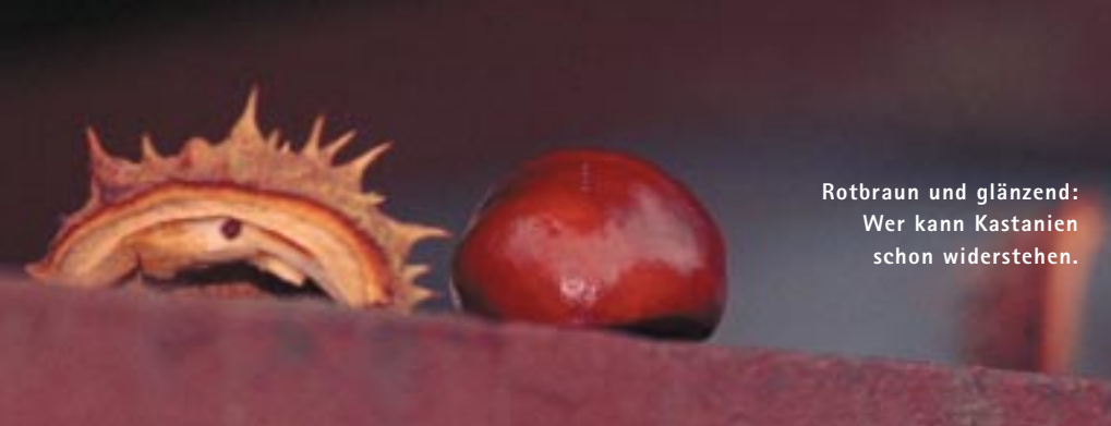
Rotbraun und glänzend: Wer kann Kastanien schon widerstehen.