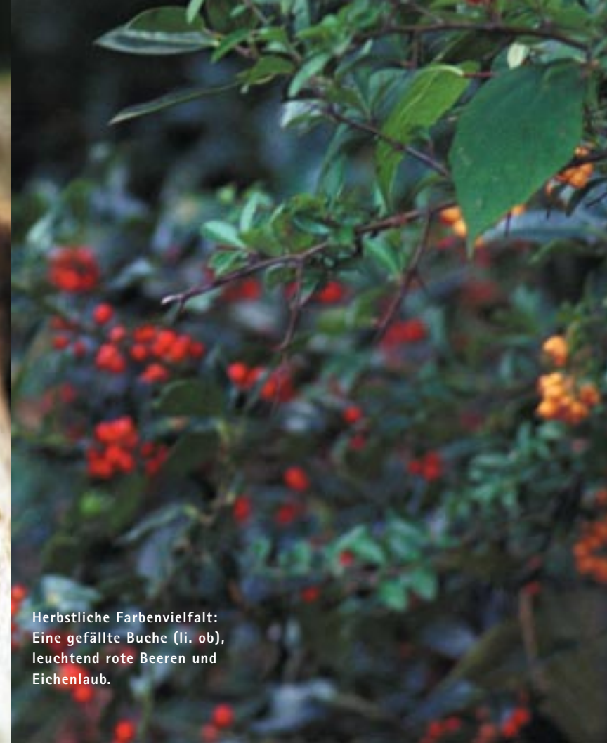
Herbstliche Farbenvielfalt: Eine gefällte Buche (li. ob), leuchtend rote Beeren und Eichenlaub.