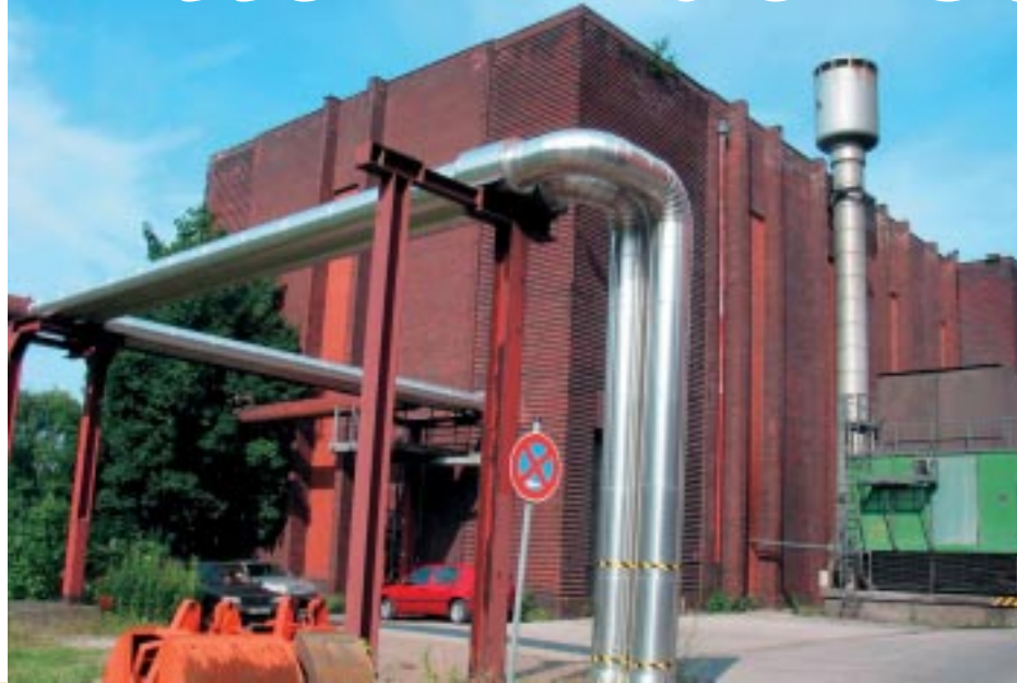
Die Fernwärme-Anlage auf dem Gelände der ehemaligen Zeche Schlängel & Eisen in Langenbochum.

Fernwärme genutzt wird. Und dabei entsteht reichlich Hitze: Die Wassertemperatur in den Rohrleitungen beträgt bei einer Außentemperatur von Minus 10° C immer noch an die 130° C. Durch „Wärmetauscher“ im Keller wird die Temperatur der Heizkörper in den Wohnungen jedoch auf maximal 90° C gesenkt.