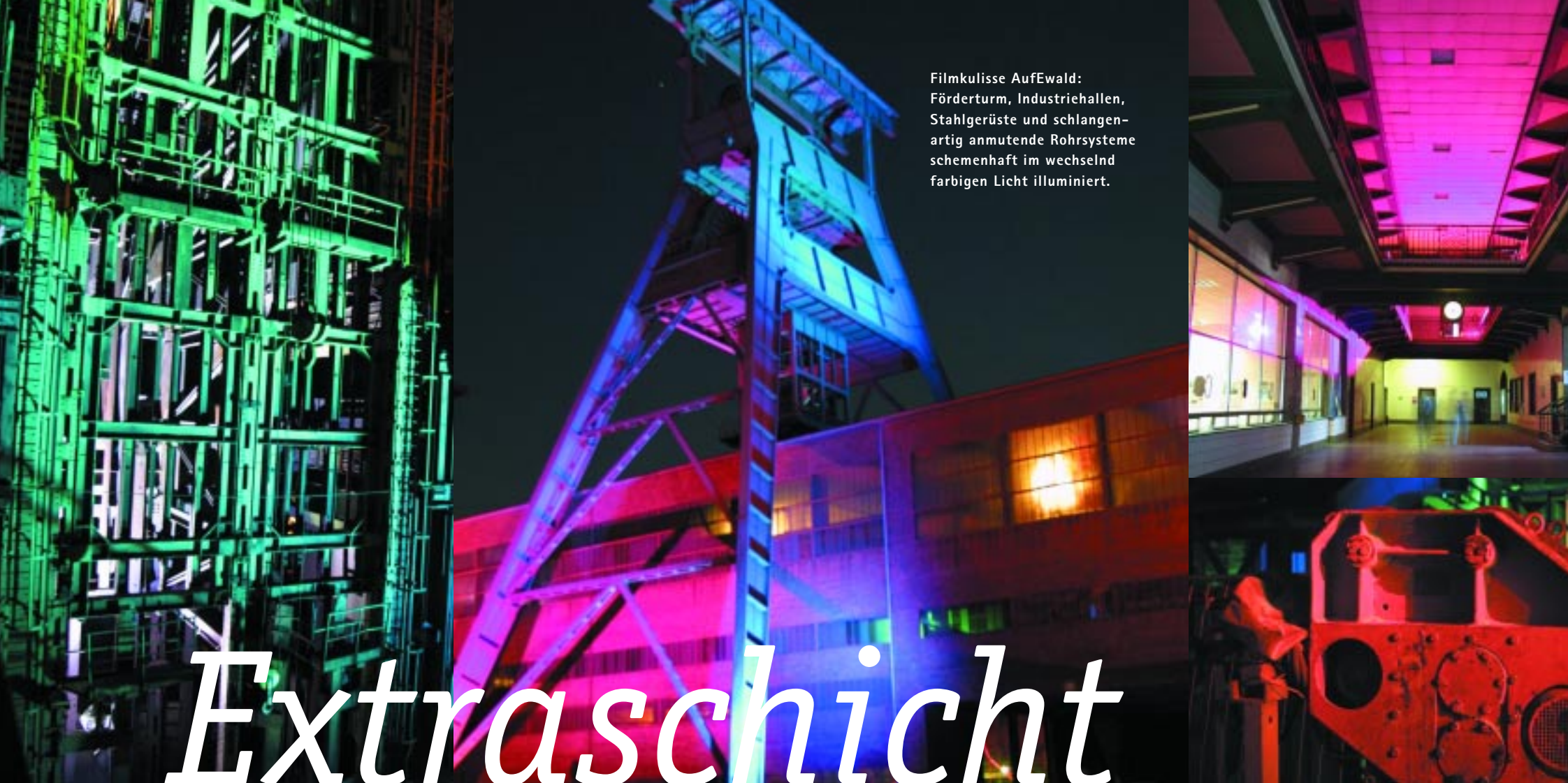
Filmkulisse AufEwald: Förderturm, Industriehallen, Stahlgerüste und schlangenartig anmutende Rohrsysteme schemenhaft im wechselnd farbigen Licht illuminiert.