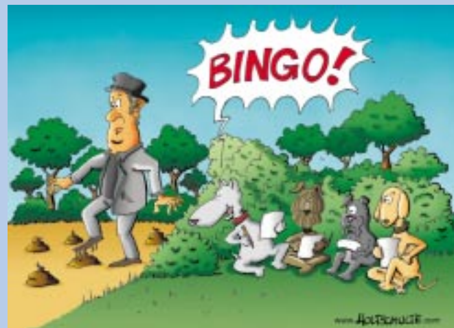
Wöchentlich zeichnet Michael Holtschulte für WAZ und Stadtspiegel.