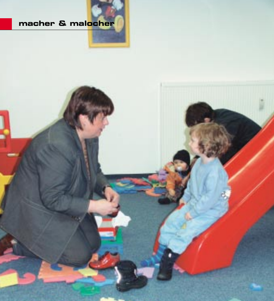
Kleiner Kunde – großer König.

Zuerst wird die Fußgröße genau bestimmt.