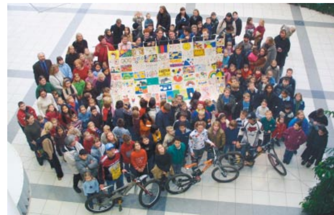
Die Hertener Olympiafahne, von Kindern aus der Stadt geschaffen, hängt im Rathaus.