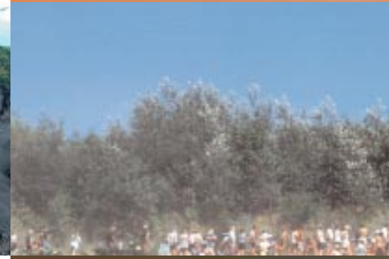
Die Halden – Hertener Berge – als gestaltete Landschaft für Sport, Freizeit und Kultur.

New York, Paris oder Herten, Recklinghausen und natürlich Düsseldorf